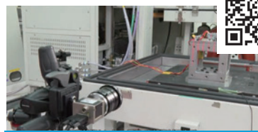
2025年11月 『非接触振動計測技術の紹介』