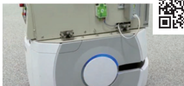
2025年7月 『協働・搬送ロボットシステムの紹介』