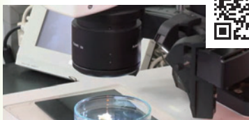
2025年9月 『食品異物分析方法の紹介』