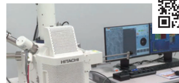
2025年5月 『走査電子顕微鏡の紹介』