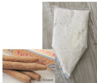
ねばりっこ冷凍すりおろし