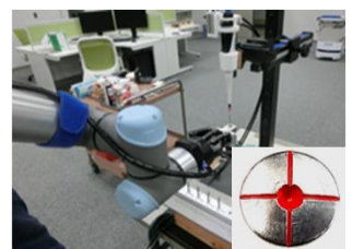
協働ロボットによる自動塗装