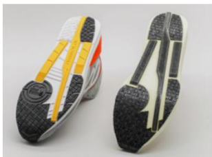
製品（左）と試作したソール（右）