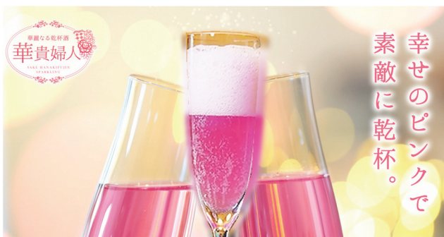
華麗なる乾杯酒 華貴婦人 スパークリング

鮮やかな色を出す天然色素や微生物による色素生産、それら色素の退色を抑える方法を検討する