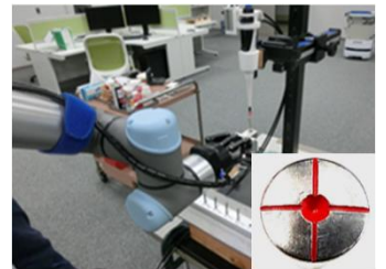
協働ロボットによる自動塗装