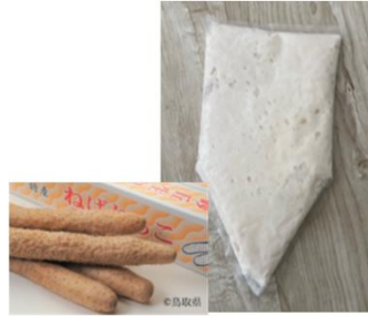
ねばりっこ冷凍すりおろし