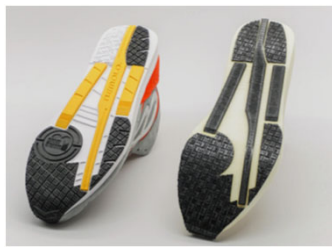
製品(左)と試作したソール(右)