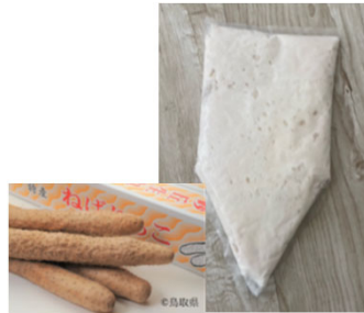
ねばりっこ冷凍すりおろし