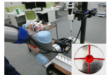
協働ロボットによる自動塗装