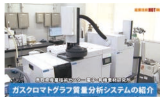
2024年3月 『ガスクロマトグラフ質量分析システムの紹介』