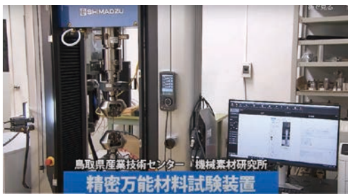
2025年3月 『精密万能材料試験装置』