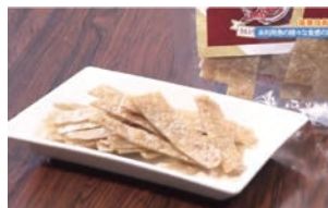
2024年7月 『未利用魚を使った様々な食感の加工食品の開発』