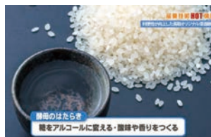
2025年1月 『利便性が向上した鳥取オリジナル清酒酵母KU61泡無し酵母』