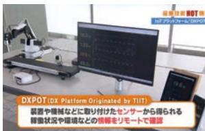
2024年9月 『CAEソフトウェアを活用した課題解決支援』