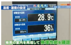
2024年5月 『温度・湿度にかかわる環境試験機』