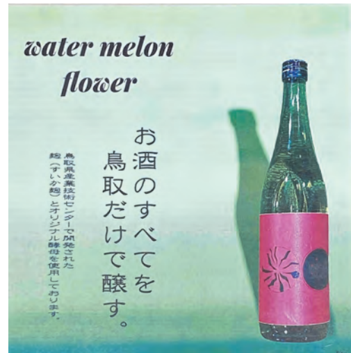
くめざくら「純米大吟醸 すいかの花」