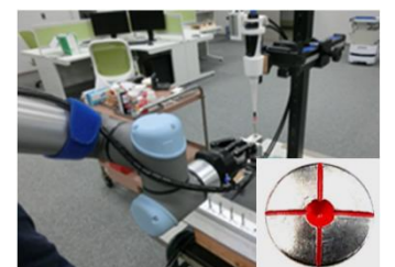
協働ロボットによる自動塗装