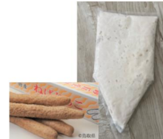
ねばりっこ冷凍すりおろし