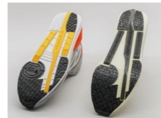
製品（左）と試作したソール（右）